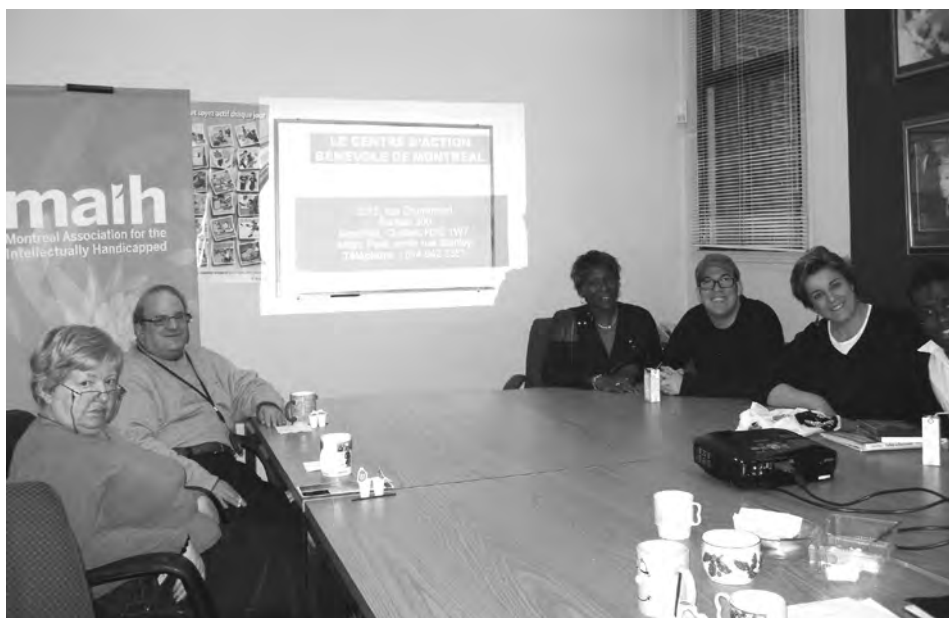
Un après-midi de partage et d'échanges à l'AMDI.

déficience intellectuelle, en permettant à ces personnes d'être des citoyens actifs au sein de leur communauté.