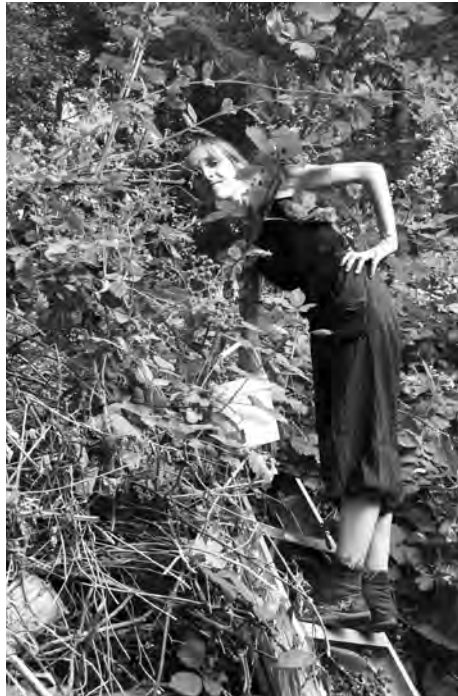
Picking blackberries on Salt Spring Island, B.C.

In order to make the most out of this venture, I turned it into an opportunity to improve my English by choosing places located in Western