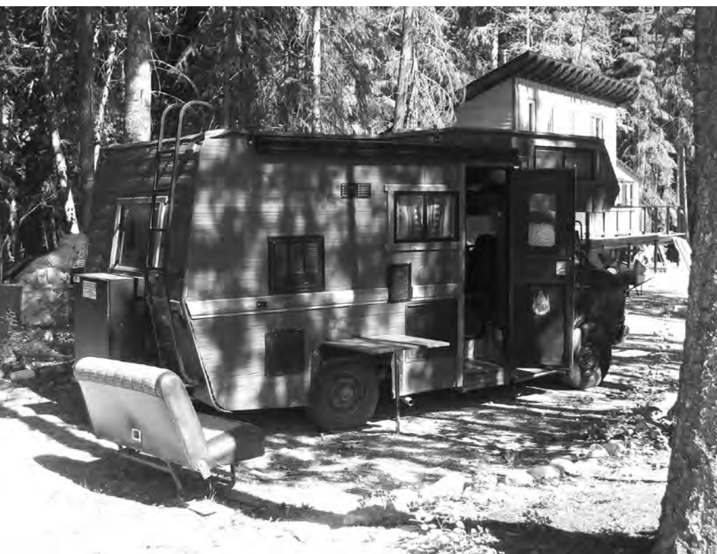
The most unlikely bedroom, which I found in Golden, B.C.