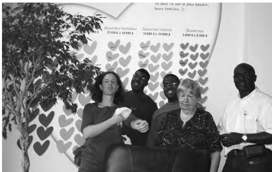
L'équipe de l'AMDI lors de son activité bénévole au Manoir McDonald.

Ces ateliers permettent de briser les préjugés à l'égard des personnes vivant avec une