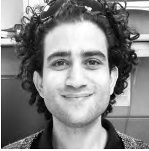
BY TAL ITZHAK, VBM volunteer