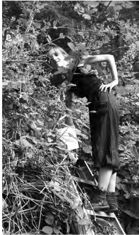
La cueillette des mûres à Salt Spring Island, BC.

Histoire de joindre l'utile à l'agréable, j'ai choisi d'aller vivre cette aventure dans l'ouest du Canada et des Etats-Unis, histoire d'"improver my English". C'est une expérience que je recommande à tout le monde tellement j'ai rencontré du beau monde et vu des paysages incroyables. J'ai effectué du Wwoofing dans cinq