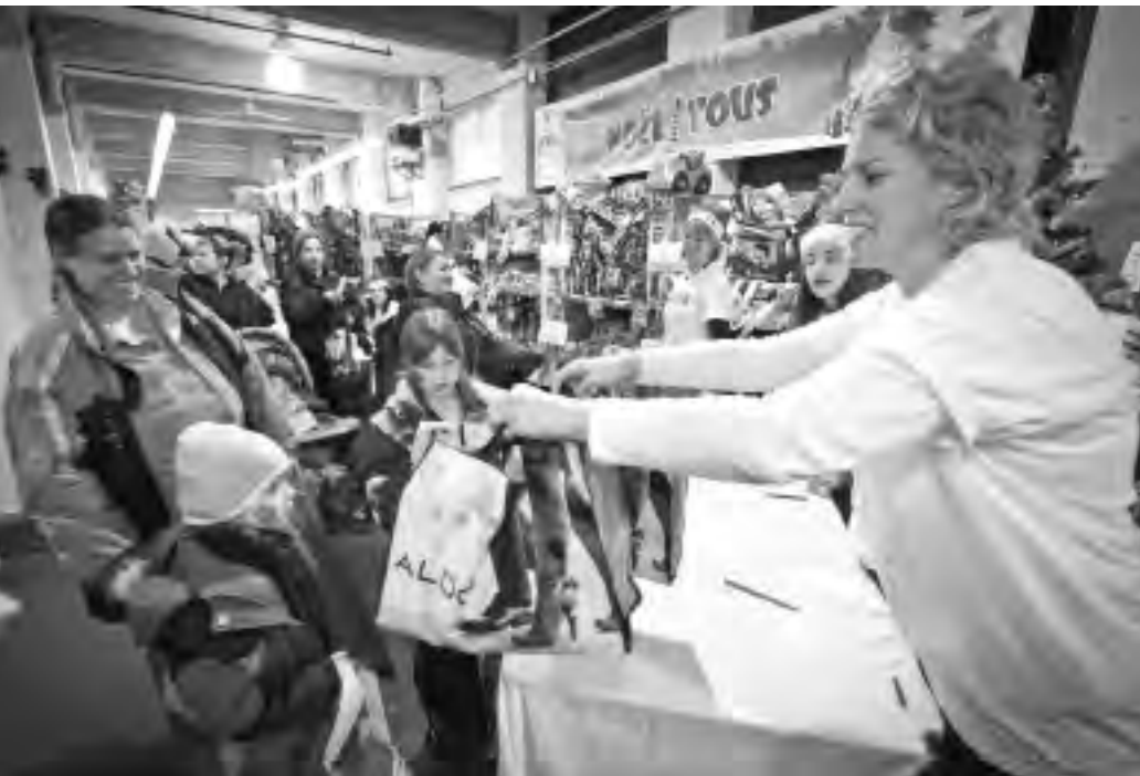
The gang at Welcome Hall Mission make like Santa's helpers, handing out Christmas Baskets of food and toys.

We don't always quite know! While the VBM deals with roughly a thousand organizations on a routine basis, our database contains files for 3,768 non-profits which have used one of our services at some point. As much as we would love to know the nitty-gritty about the programs and services offered by all our clients, it's a challenge to keep in touch with everyone, not to mention gain an understanding of the daily realities with which each must contend.