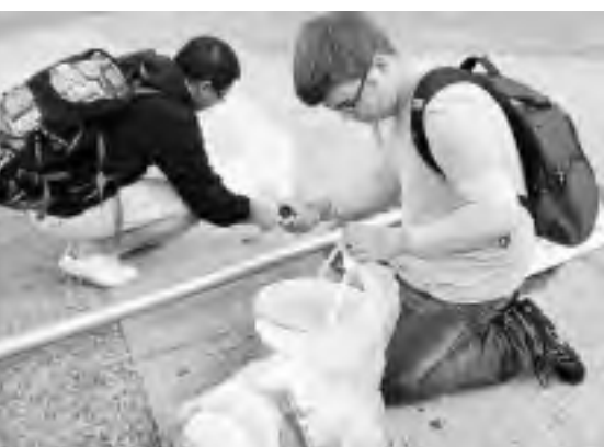
Cleanup in downtown Vancouver following a riot after the Canucks lost the Stanley Cup Final game seven against the Boston Bruins at Rogers Arena in Vancouver, BC., on June 16, 2011.